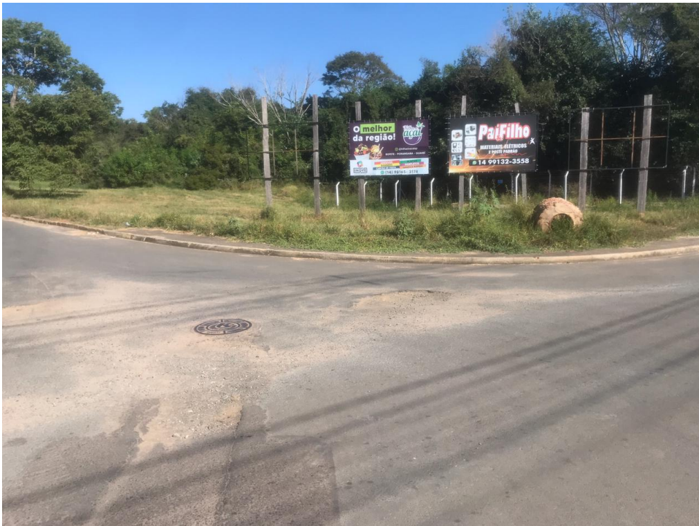
Figura 11 - Buraco no asfalto da avenida bofete-pardinho na esquina com a rua José Jacinto.