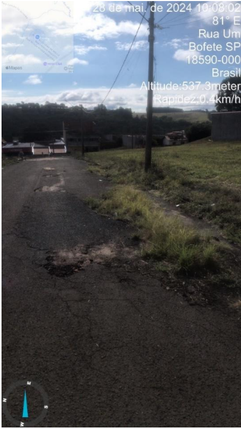
Imagem 58 - Buracos na rua Nabor Ribeiro da Silva