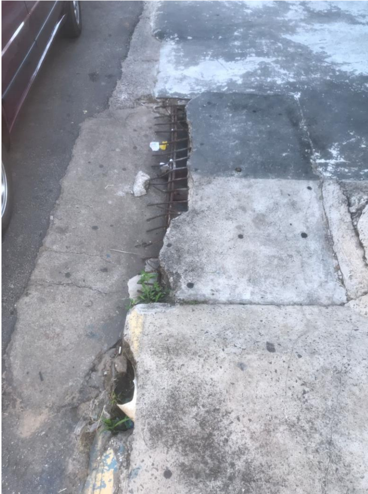
Figura 9 – Tampa de boca de lobo quebrada com ferragem aparente. Endereço: Avenida Bofete-Pardinho (Em frente ao Supermercado do Fio).