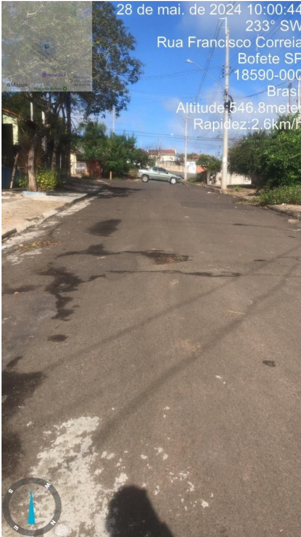
Imagem 50 - Buracos na Rua Francisco Correia.