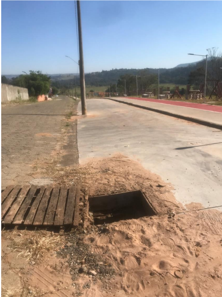
Figura 3 - Bueiro sem tampa, oferecendo riscos aos pedestres na calçada/estacionamento do Parque Urbano. Realizar reparos necessários para a colocação de uma tampa reforçada. Endereço: Rua Antônio F Sobrinho, frente com José Irineu de Souza.