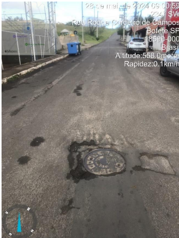
Imagem 19 - buracos na Rua Roque Cordeiro de Campos