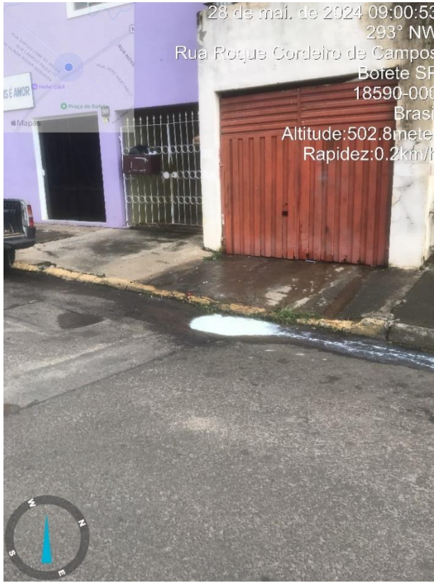
Imagem 18 – Buraco em sarjeta onde há empoçamento de água, na R. Roque Cordeiro de Campos (ao lado do mercado Tom e Jerry).