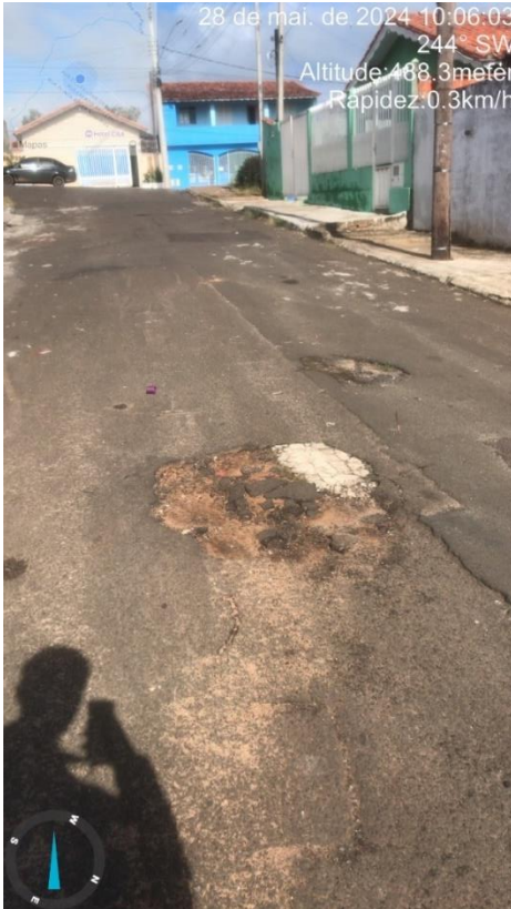
Imagem 55 – Buraco na Rua vereador José Jacinto.