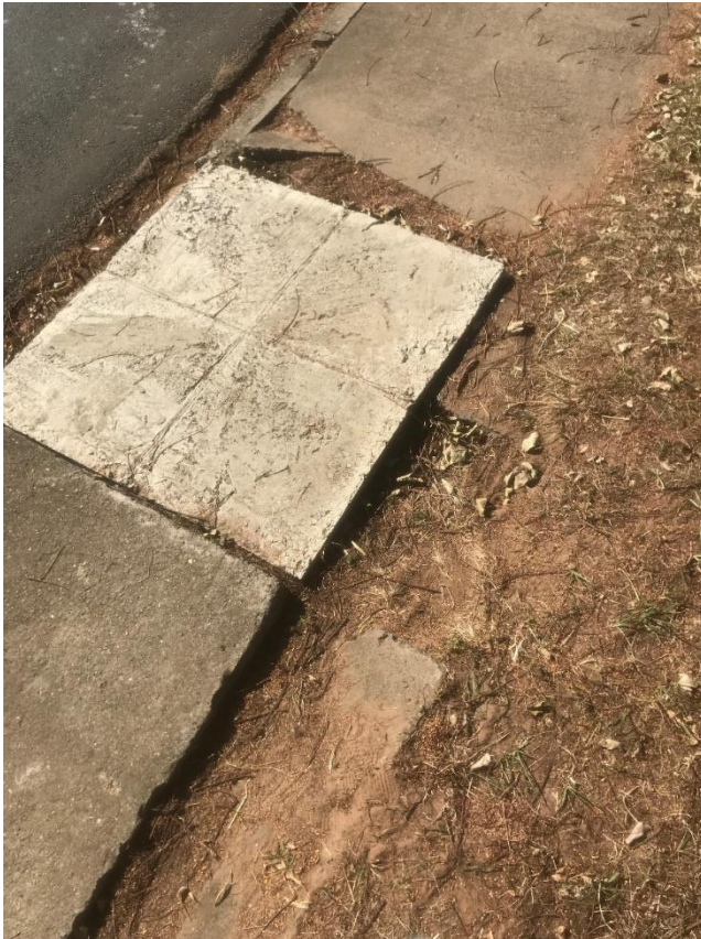
Figura 21 – Realizar consertos na calçada da Praça da Cohab, entre avenida Bofete-Pardinho e rua Maria Julia Vieira.