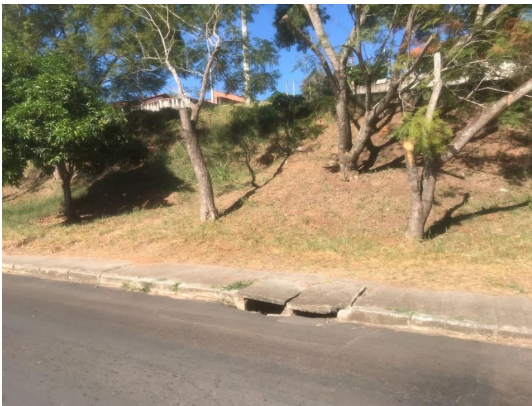
Figura 14 – Tampas de boca de lobo afundadas na Avenida Bofete-Pardinho ( próx. À trilha de acesso à CDHU I).