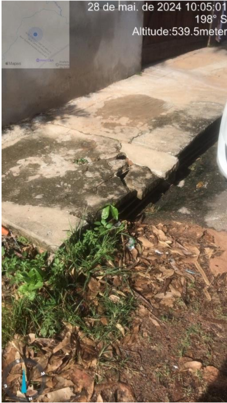
Imagem 54 – Boca de lobo danificada rua vereador José Jacinto.