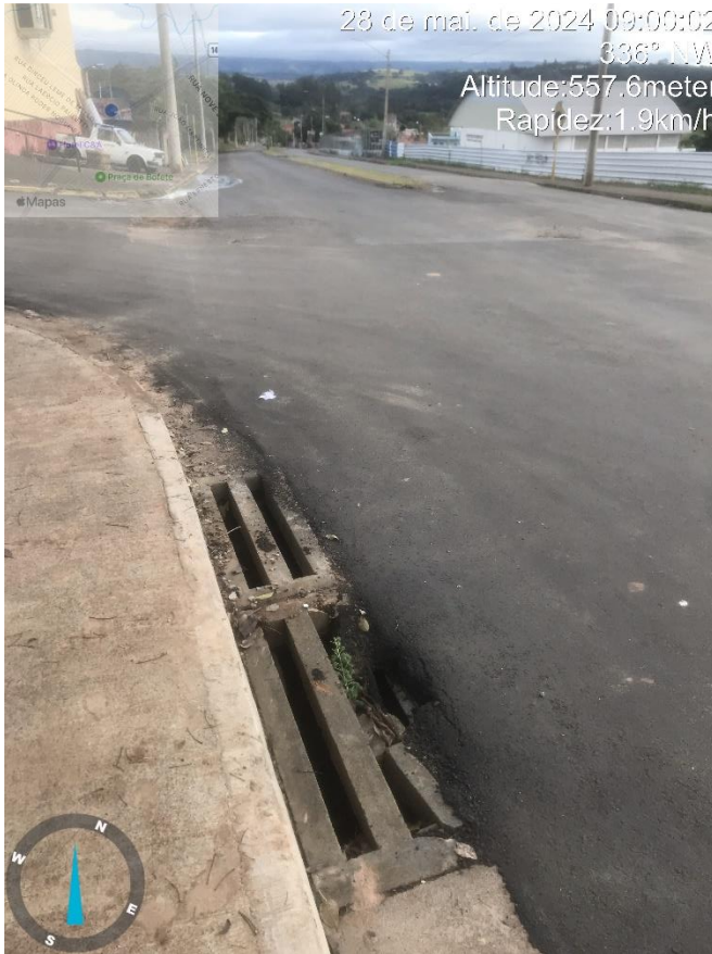
Imagem 15 – Boca de lobo danificada na esquina com Av. bofete-Pardinho e Rua Roque Cordeiro de Campos.