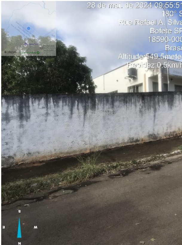
Imagem 45 - Buracos rua José Antunes da Silva, próx. ao Ganha Tempo.