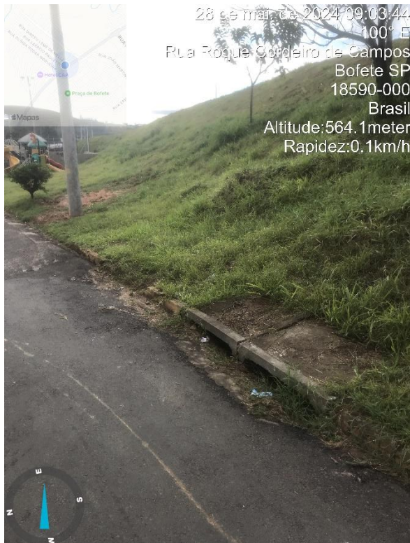
Imagem 21 - Boca de lobo rua roque Cordeiro de Campos