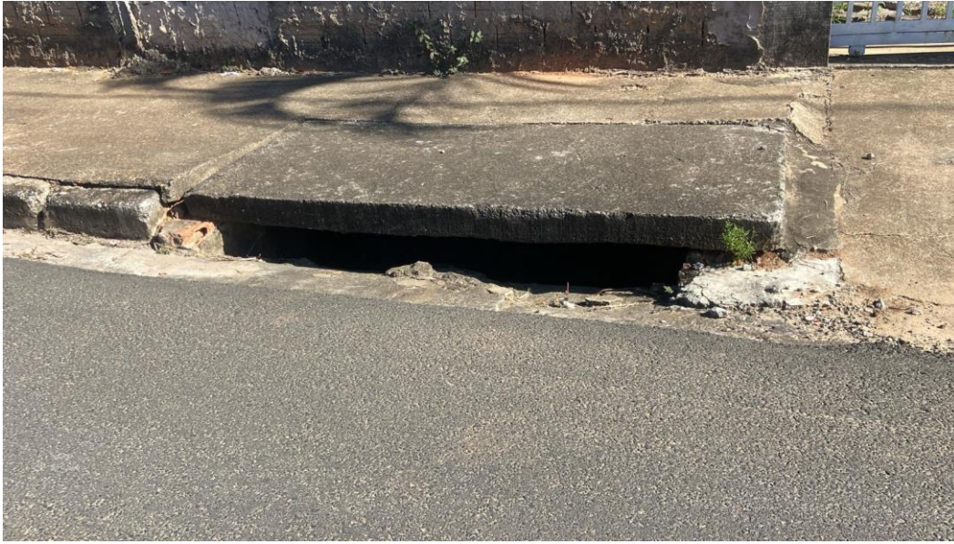
Figura 6 – Verificar tampa de boca de lobo na Rua Rafael da Silva.