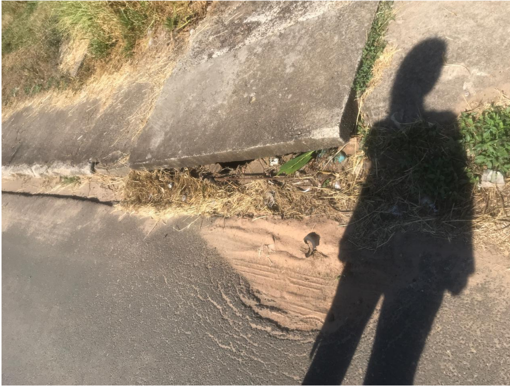
Figura 12- Buraco no asfalto e tampa de boca de lobo levantada na Avenida Bofete-Pardinho, na altura do nº500 próximo à Rua José Jacinto (em frente à passarela de pedestres).