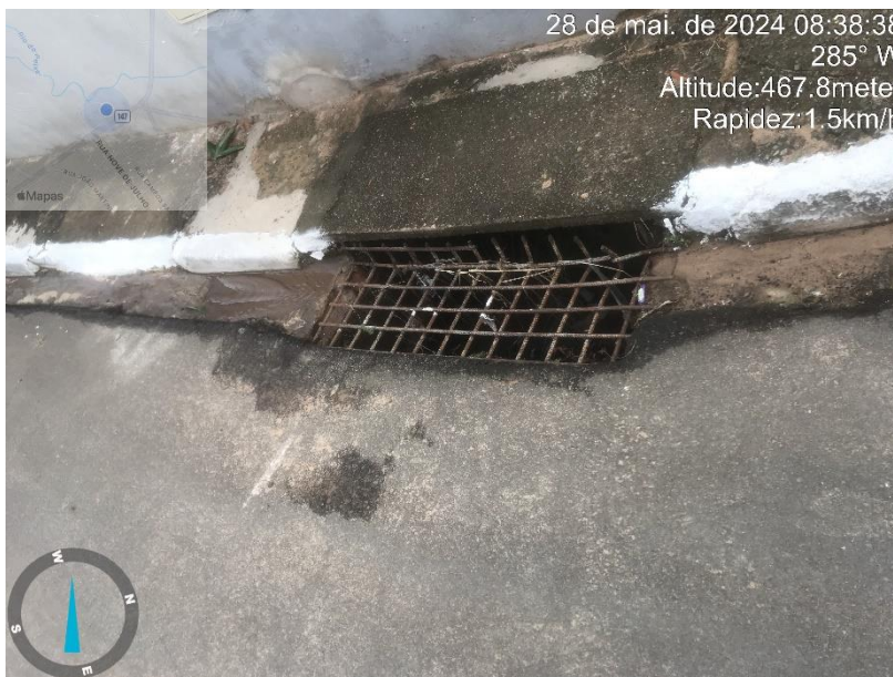
Imagem 7 – Boca de lobo na esquina da Rua Olinda Pinto com R. José Silveira.