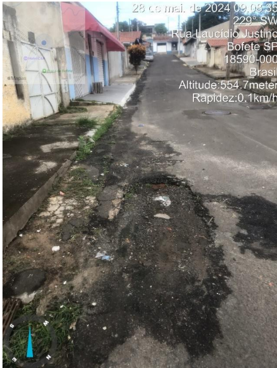
Imagem 29 - Buracos na rua Laucidio Justino