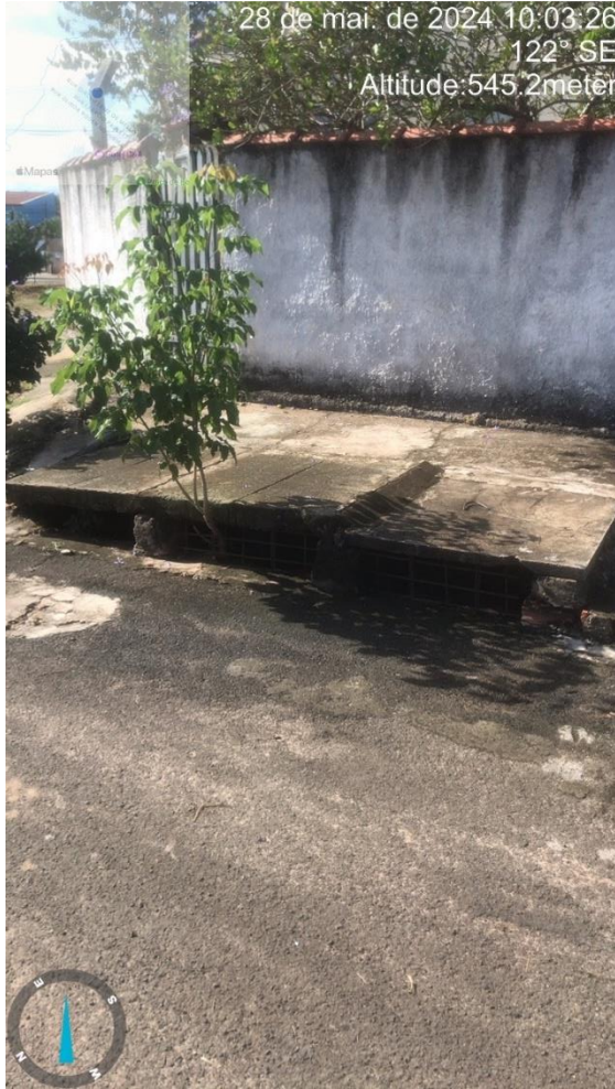
Imagem 52 –Bocas de lobo Rua Antônio Cordeiro Neto