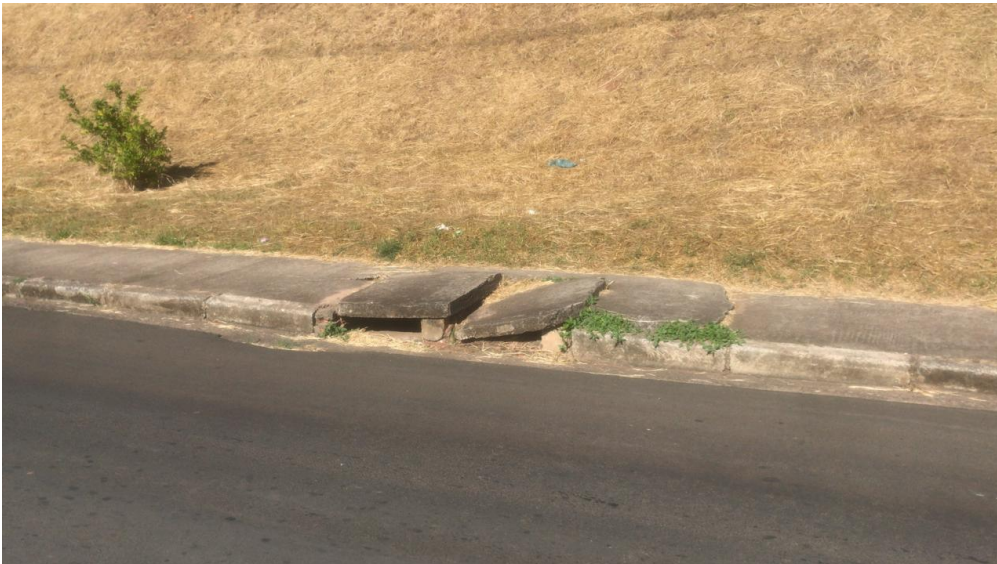
Figura 16 tampas de boca de lobo afundadas na avenida Bofete-Pardinho na altura da rua Terezinha Machado.