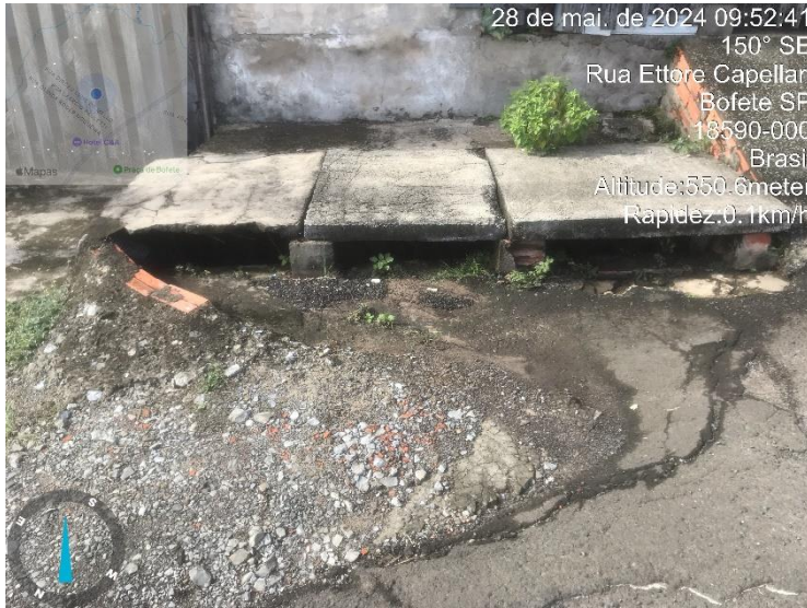
Imagem 43 – Bocas de lobo Rua Ettore Capellari.