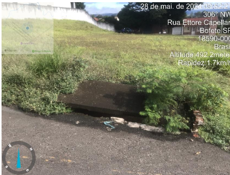
Imagem 42 – Boca de lobo Terreno da prefeitura (ao lado da Casa Transitória). Rua Ettore Capellari.