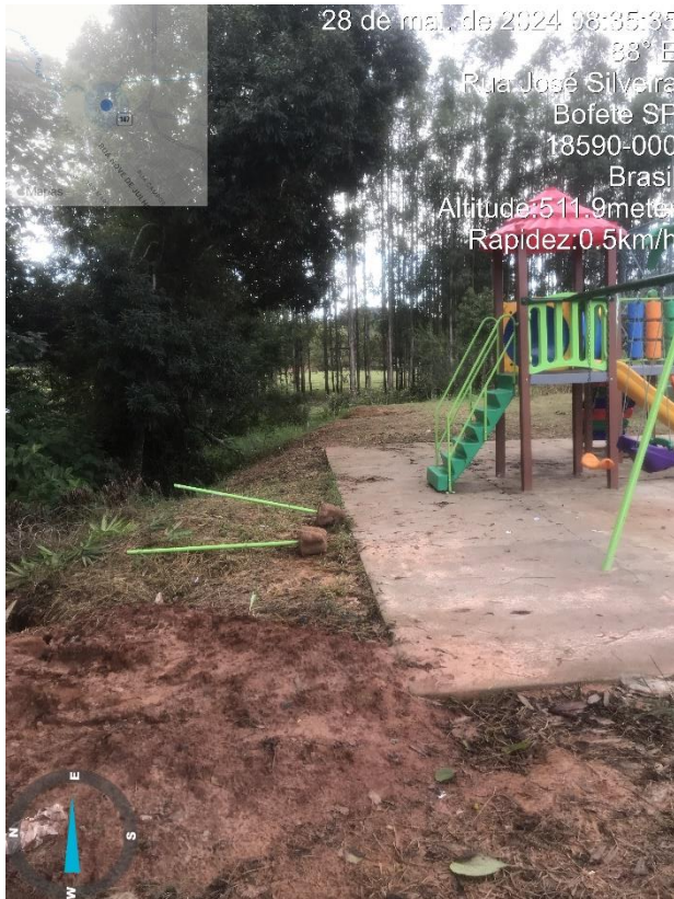
Imagem 6 – Verificar disponibilidade para aterrar o fundo do playground e Campo Society do Trevo.