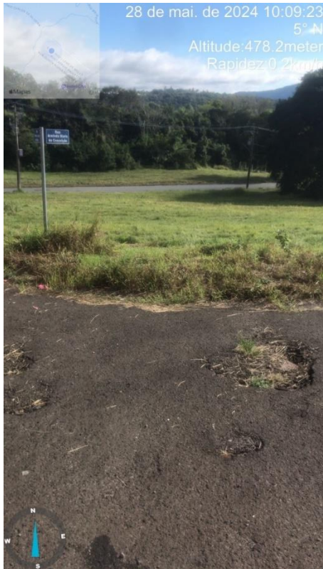
Imagem 59 – buracos na rua Dirceu Leme de Melo, esquina com R. Arminda Maria da Conceição.