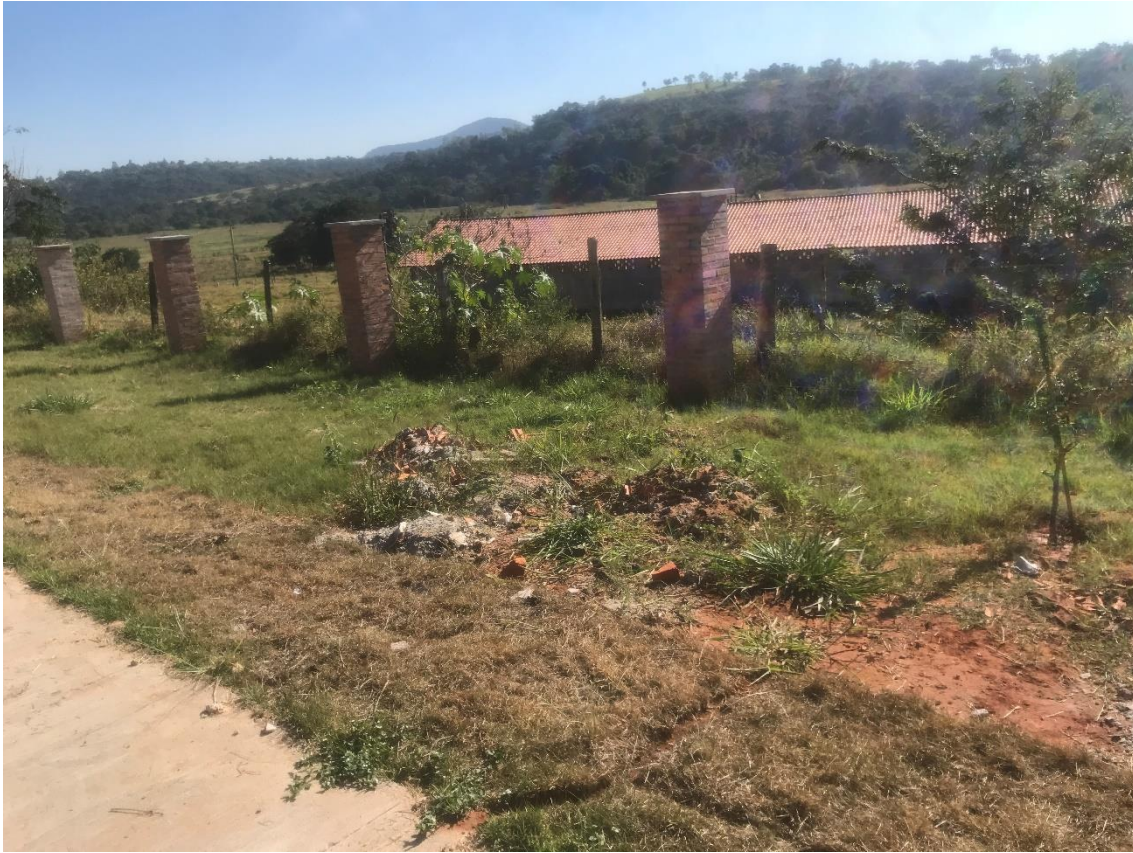
Figura 2- limpeza de entulhos no gramado do parque urbano da CDHU II