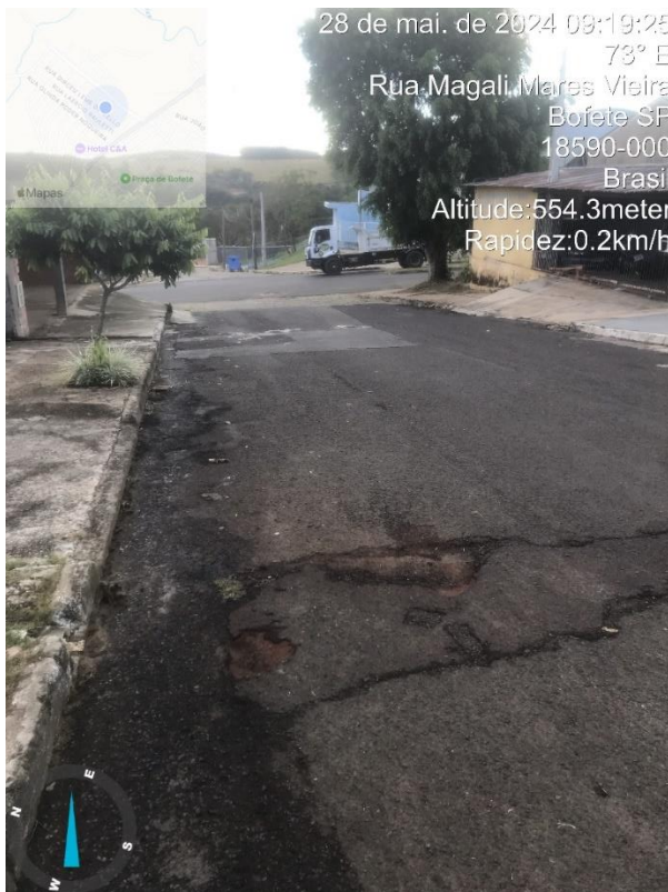
Imagem 36 – Buracos na Rua Magali Maris Vieira