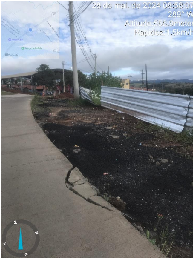
Imagem 14 – Calçada danificada (próx. às instalações do consórcio).