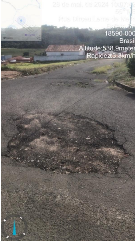
Imagem 57 - Buraco na rua Dirceu Leme de Melo, esquina com Nabor Ribeiro da Silva.