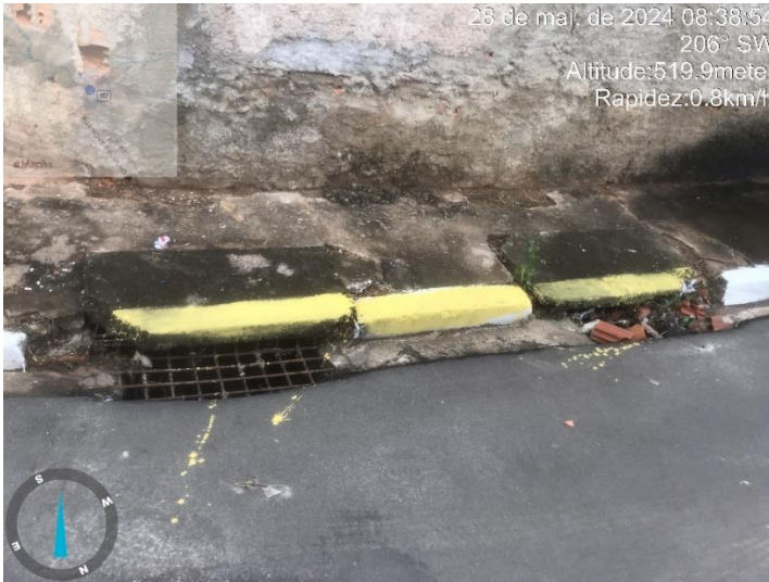
Imagem 8 - Boca de lobo na esquina da Rua Olinda Pinto com R. José Silveira.