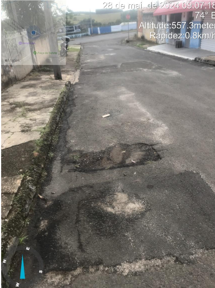
Imagem 26 - Buracos na rua Laucidio Justino