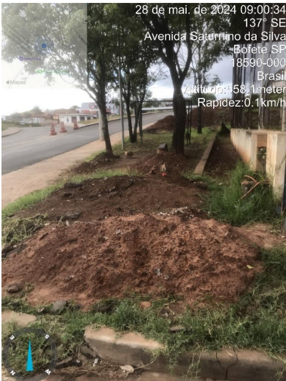
Imagem 17 – Calçada danificada e obstruída na quadra da Rua Roque Cordeiro de Campos.