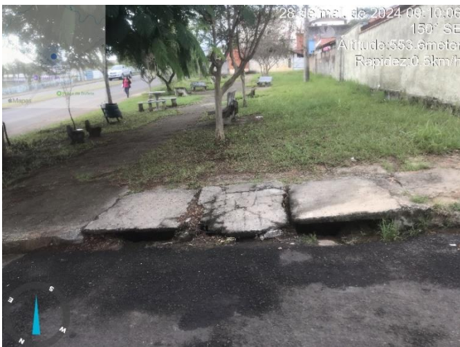
Imagem 32 – Bocas de lobo da praçinha, rua Maria Julia Vieira.