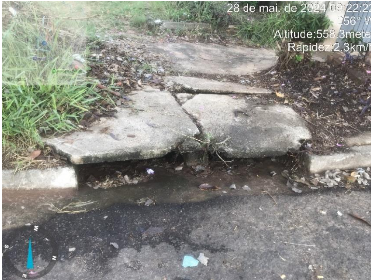
Imagem 39 - Boca de lobo Dirceu Leme de Melo