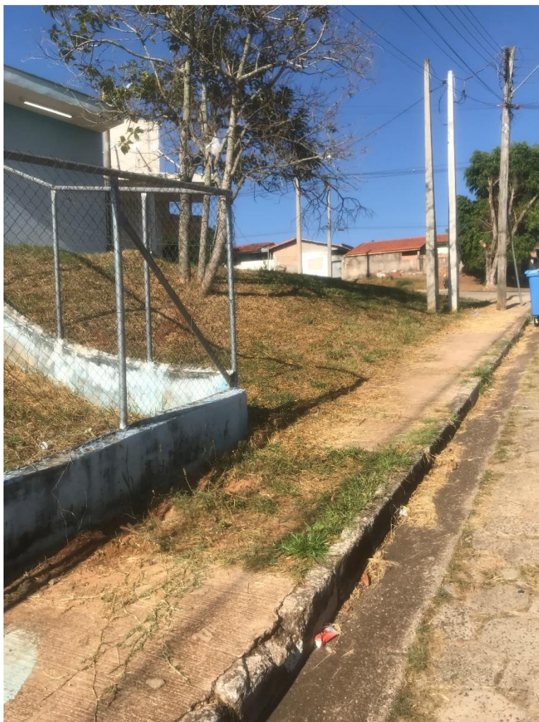
Figura 6 Recolhimento dos matos secos provenientes das roçagens, calçadas do centro olímpico.