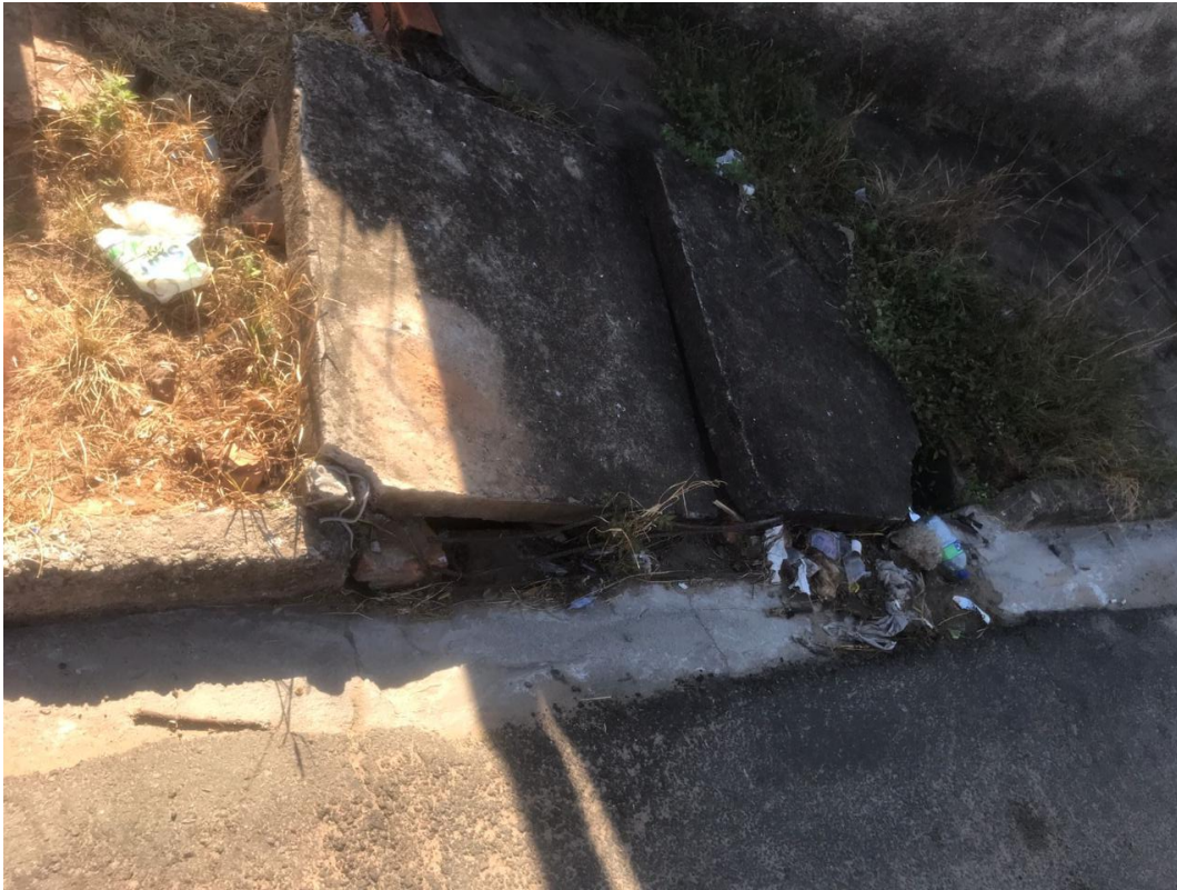
Figura 10 – tampas de boca de lobo tombadas na Avenida bofete-pardinho (altura do nº 500)