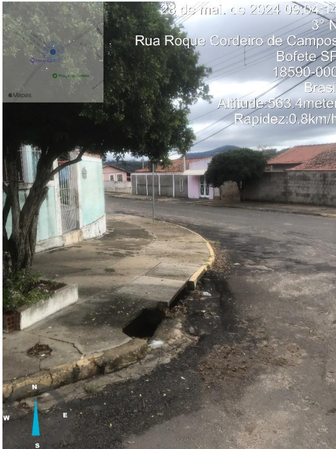
Imagem 24 – Tampa de boca de lobo quebrada (oferece riscos), esquina com Rua Roque Cordeiro de Campos e R. Dirceu Leme de Melo.