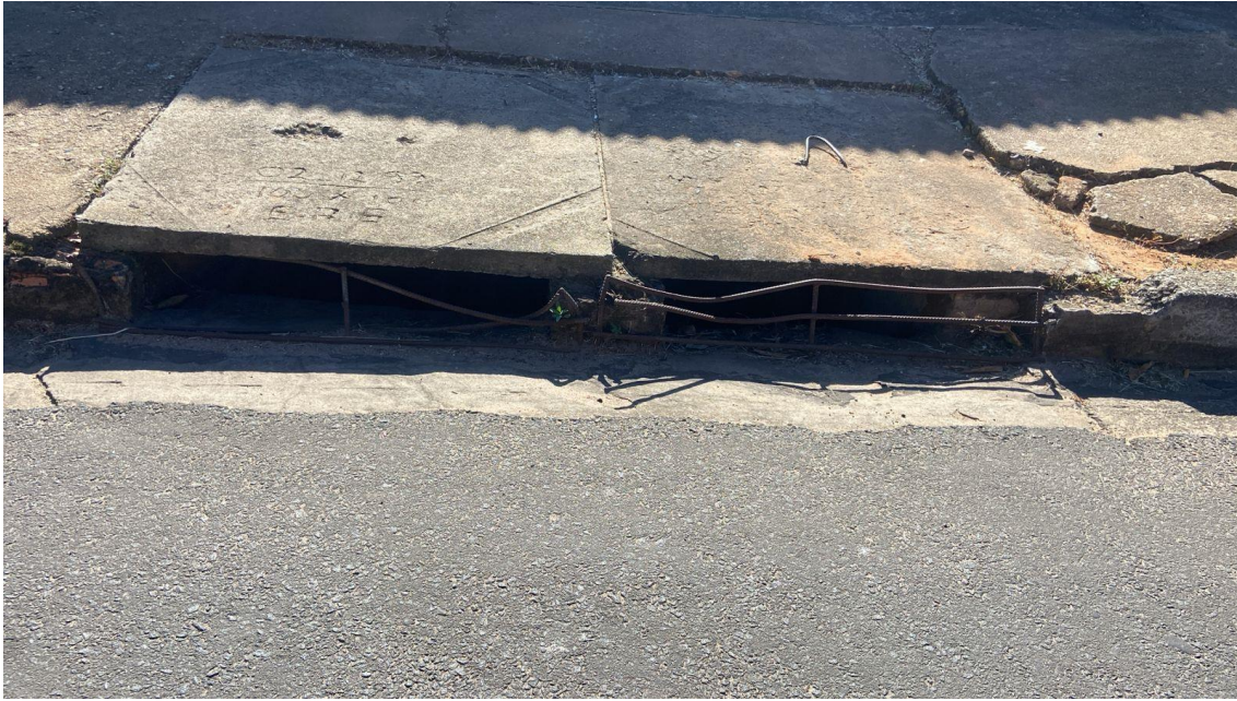
Figura 17 – Avaliar parte quebrada ao redor das tampas da boca de lobo, na avenida Bofete-Pardinho.