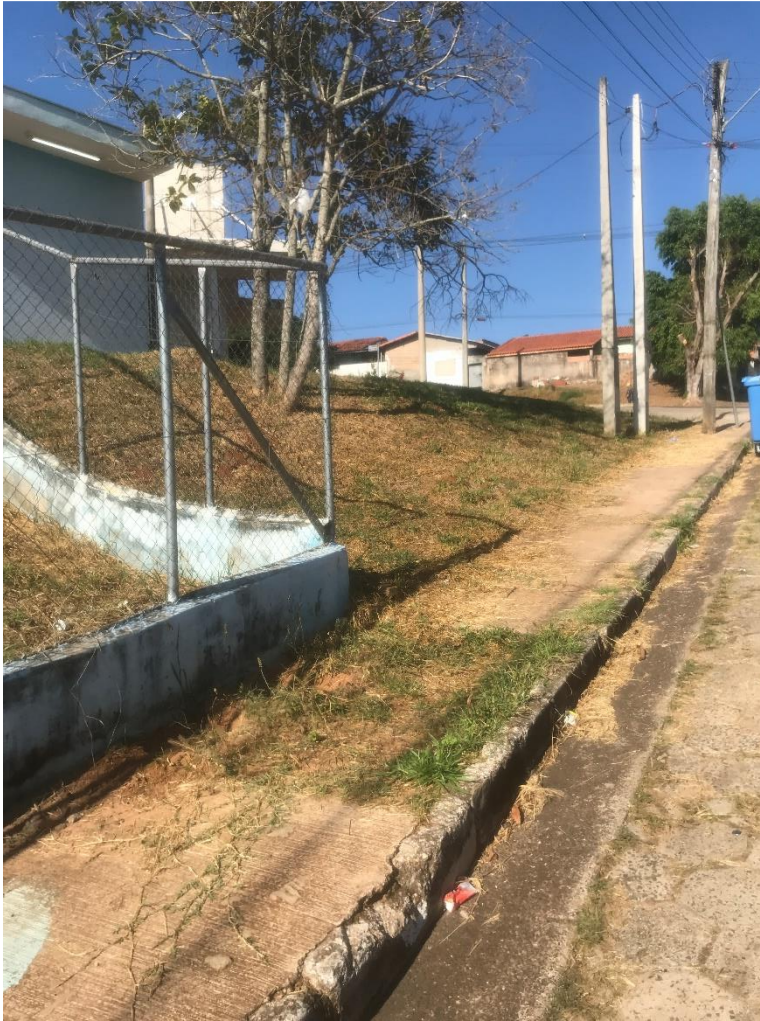
Figura 23 Realizar consertos na calçada da Praça da Cohab, entre avenida Bofete-Pardinho e rua Maria Julia Vieira.