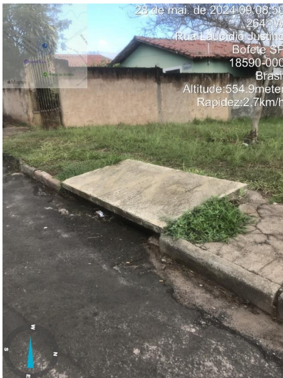
Imagem 30 – Praça com trecho sem calçada e tampa de boca de lobo levantada, Rua Laucidio Justino.