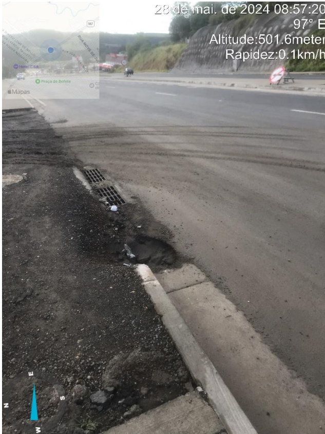
Imagem 13 –Buraco em sarjeta (próx. às instalações do consórcio).