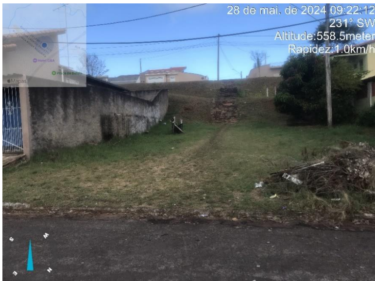
Imagem 38 - Travessa Cohab (Rua Dirceu Leme de Melo).