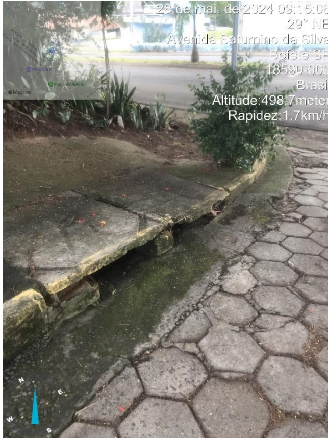
Imagem 33 – Bocas de lobo, rua Maria Julia Vieira, esquina com Av. Bofete-Pardinho