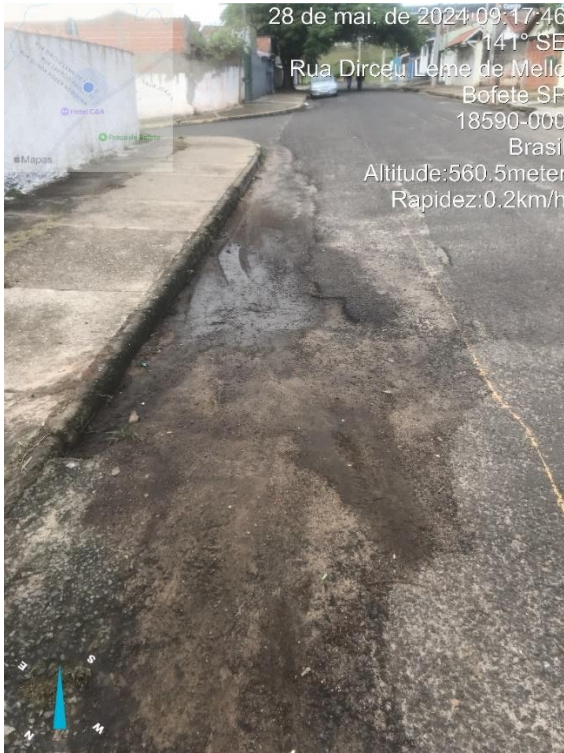
Imagem 35 – Buraco na rua Dirceu Leme de Melo, esquina Maria Julia Vieira.