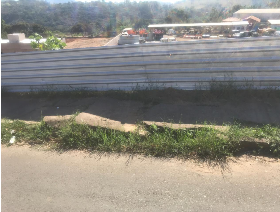
Figura 19- Tampas da boca de lobo na calçada do centro olímpico na Avenida Bofete-Pardinho.