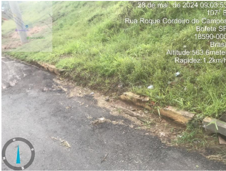
Imagem 22- Guia quebrada Rua Roque Cordeiro de Campos.