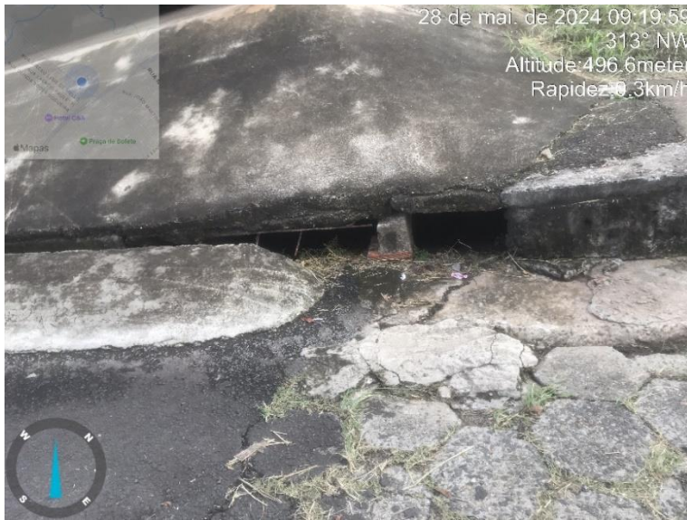
Imagem 37 - Boca de lobo Rua Magali Maris Vieira, próx. esquina com Av. Bofete-Pardinho.