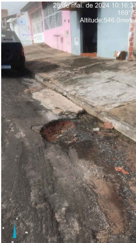
Imagem 64 - Buracos na rua e sarjeta, Rua Dirceu Leme de Melo.