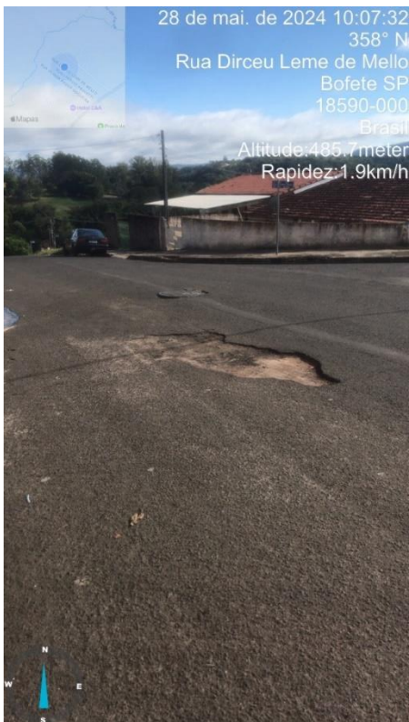
Imagem 56 - Buraco na rua Dirceu Leme de Melo, esquina com Nabor Ribeiro da Silva.