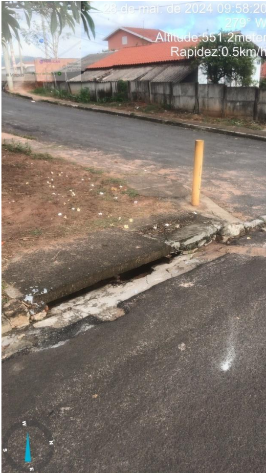
Imagem 46 - Boca de lobo Rua Dirceu Leme de Melo, esquina com R. Francisco Correia