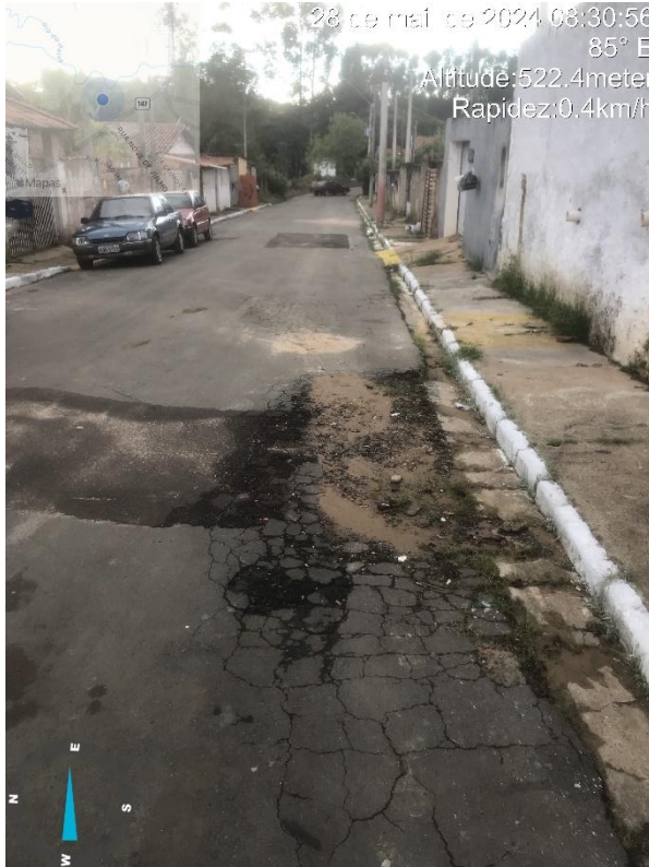
Imagem 4 – Buraco rua José Silveira, n110