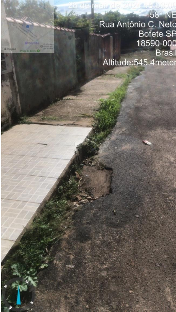
Imagem 51 - Buracos na rua Antônio Cordeiro Neto