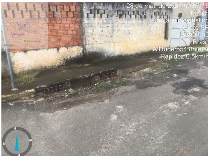
Imagem 28 – Boca de lobo, rua Laucidio Justino, esquina com Av Bofete-pardinho.