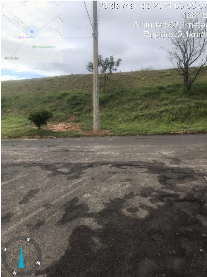
Imagem 25 – Buracos na Rua Dirceu Leme de Melo, esquina com Rua Roque Cordeiro de Campos.