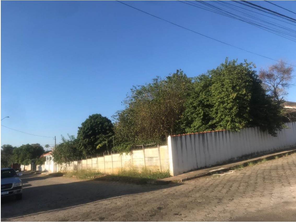
Figura 7 – Roçagem da Calçada do imóvel alugado pela prefeitura, no endereço Rua Sultana Megid Chaguri, esquina com Apolinário Alves 124