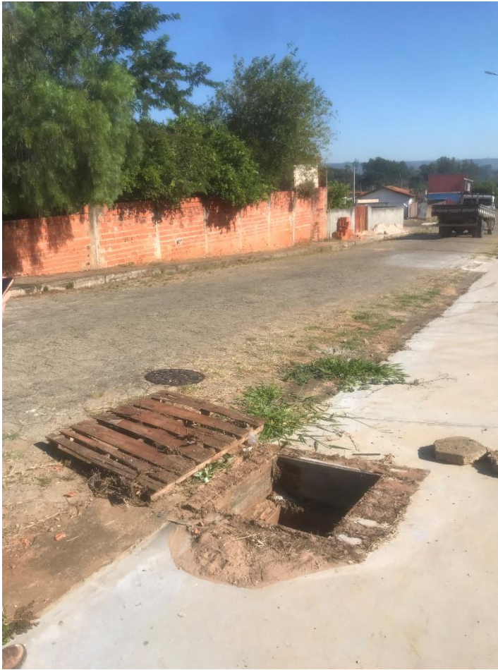
Figura 2 - Bueiro sem tampa, oferecendo riscos aos pedestres na calçada/estacionamento do Parque Urbano. Realizar reparos necessários para a colocação de uma tampa reforçada. Endereço: Rua Antônio F Sobrinho, frente com Terezinha C Machado.