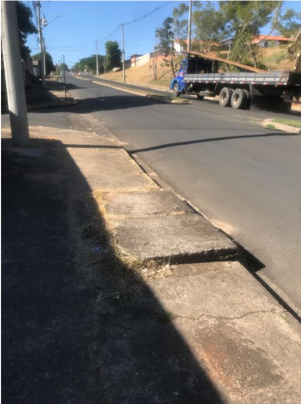
Figura 15 – tampas de boca de lobo com degraus na Avenida Bofete-Pardinho.