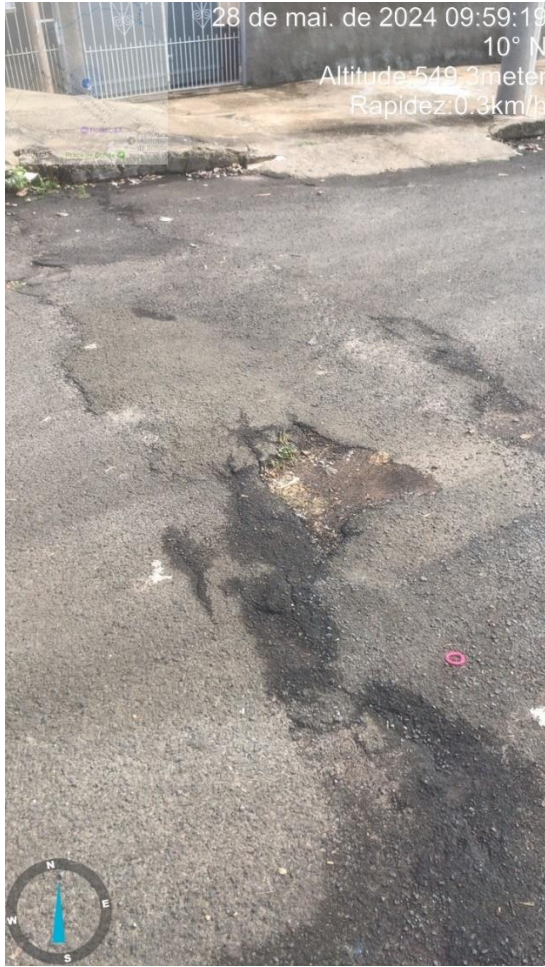
Imagem 47 – Buraco na Rua Francisco Correia