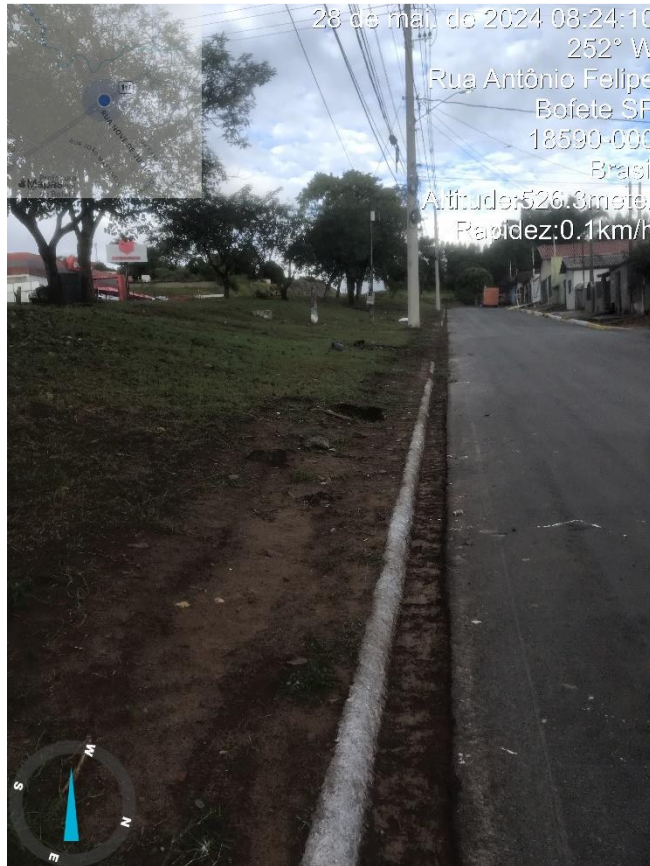
Imagem 1- Verificar possibilidade de fazer calçada no canteiro de entrada dos pedestres que acessam o bairro do Trevo. Rua Antônio Felipe.

Em visita realizada ao Bairro Trevo e CDHU I foram realizados apontamentos quanto à conservação das ruas, calçadas, bocas de lobo e demais áreas competentes à prefeitura, para que sejam realizados os reparos necessários para garantir a segurança e bem-estar das pessoas que ali transitam. Seguem imagens dos locais apontados, para que sejam avaliadas pela equipe de obras.