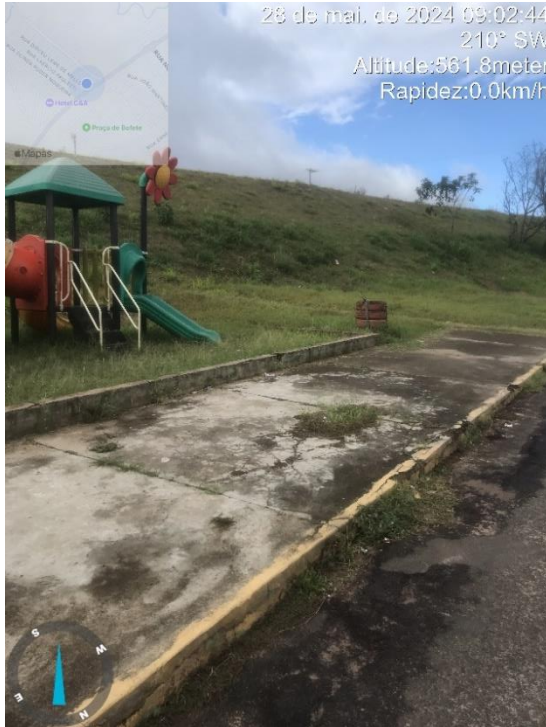
Imagem 20 – Buracos na sarjeta ao lado do parquinho da rua Roque Cordeiro de Campos.