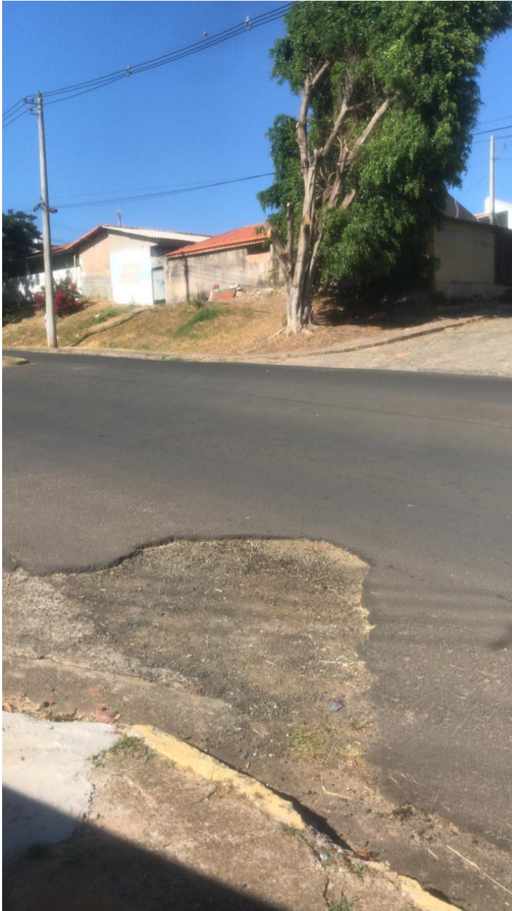
Figura 18 – Buraco no asfalto entre Avenida Bofete-Pardinho e Ernestina Ebúrneo.