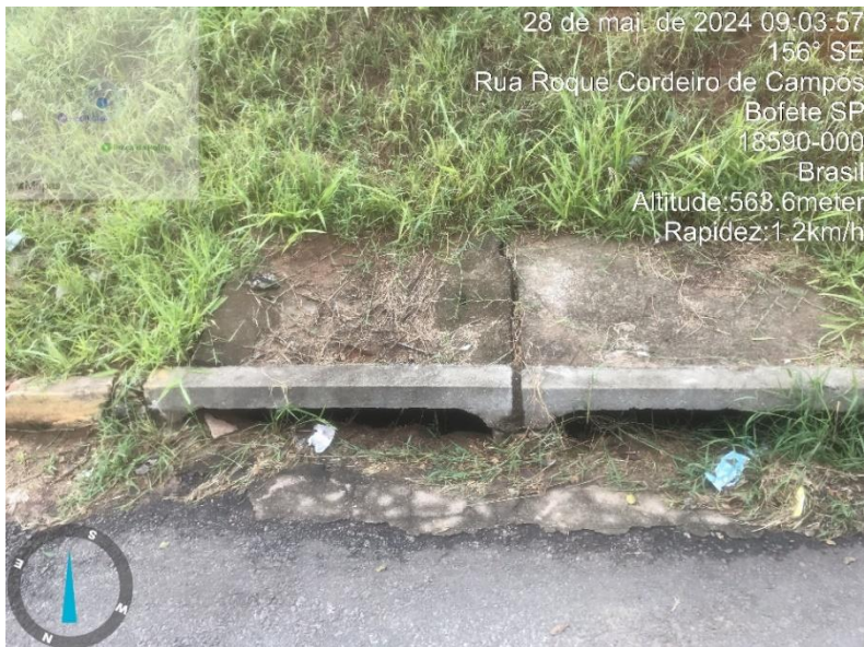
Imagem 23 – Boca de lobo Rua Roque Cordeiro de Campos.