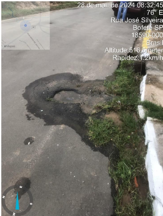
Imagem 5 – Buraco na Rua José Silveira, 89. Na ocasião da visita havia água parada.