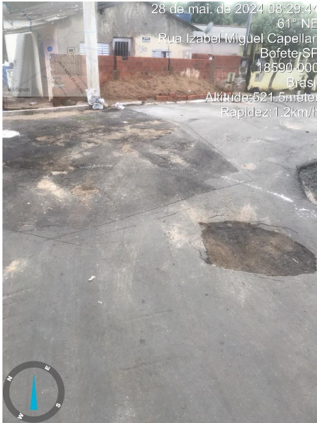
Imagem 3 – Buracos na rua Izabel Miguel Capellari, com José Silveira.