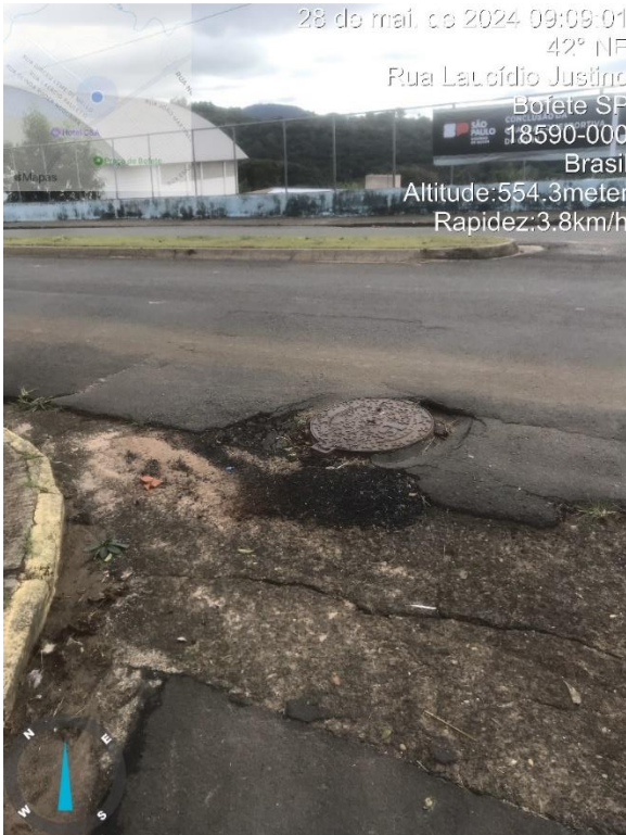
Imagem 31 – buracos na Av. Bofete-Pardinho, esquina com Laucidio Justino.