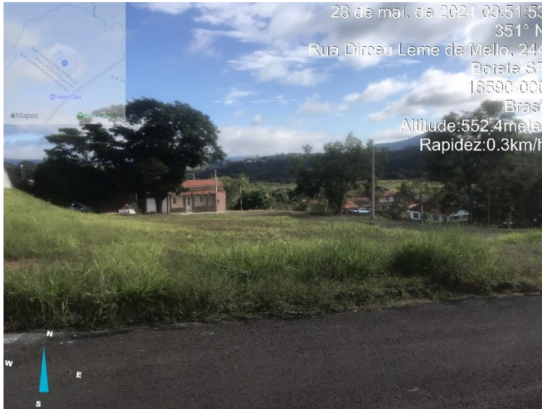
Imagem 41 - Terreno da prefeitura sem calçada (ao lado da Casa Transitória). Rua Ettore Capellari.