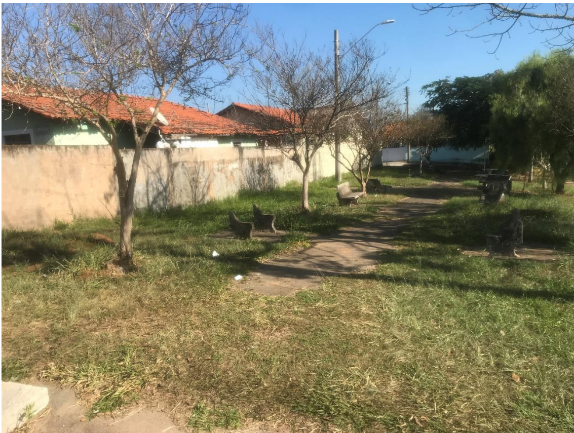
Figura 20 – Verificar possibilidade de troca dos bancos de concreto e providenciar roçagem da grama. Local: Praça da Cohab, entre avenida Bofete-Pardinho e rua Maria Julia Vieira.