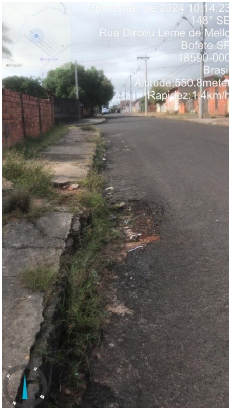
Imagem 63 - Buracos na rua e sarjeta, Rua Dirceu Leme de Melo.