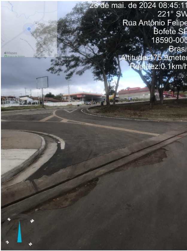
Imagem 11 - Buraco na valeta R. Antônio Felipe