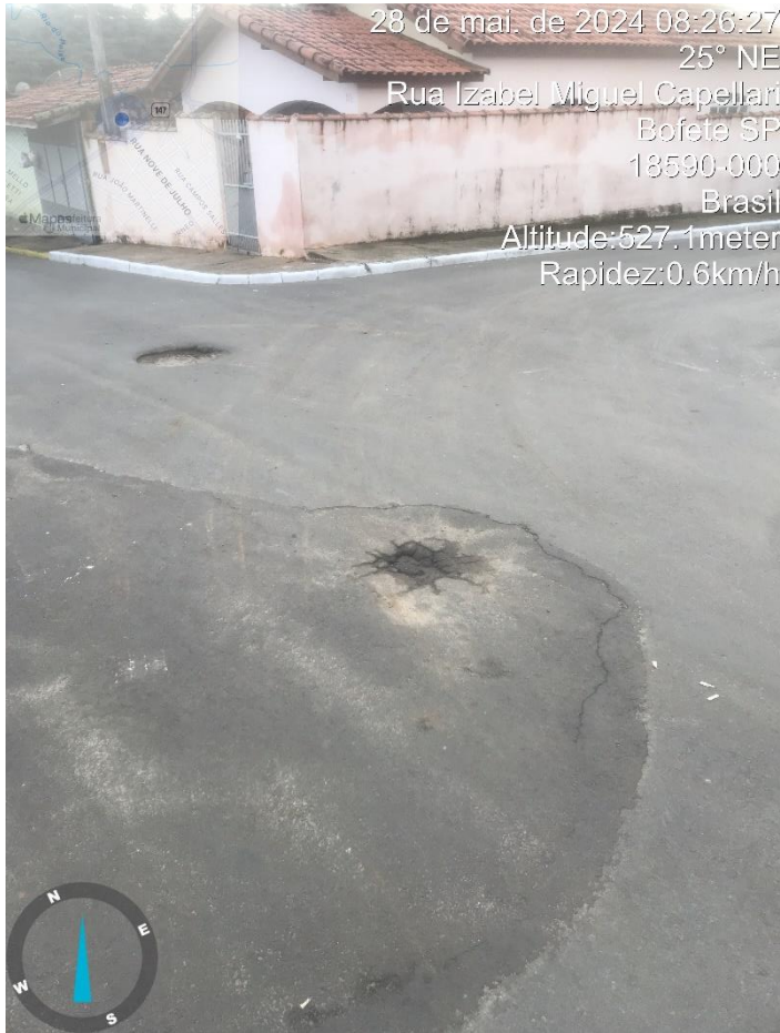
Imagem 2 – Buraco na Rua Izabel Miguel Capellari, esquina com Rua Olinda Pinto da Silva.