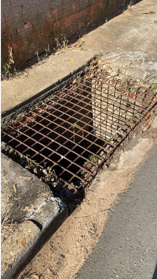
Figura 1- Grade faltante em bueiro na rua Teresinha C Machado – Providenciar reparos necessários para colocação de tampa de concreto.

Em visita realizada ao Bairro CDHU II foram realizados apontamentos quanto à conservação das ruas, calçadas, bocas de lobo e demais áreas competentes à prefeitura, para que sejam realizados os reparos necessários para garantir a segurança e bem-estar das pessoas que ali transitam. Seguem imagens dos locais apontados, para que sejam avaliadas pela equipe de obras.