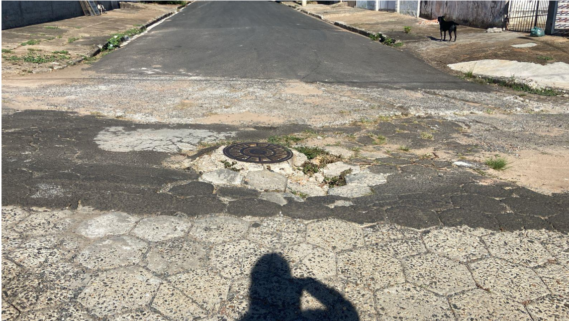
Figura 4 - Buraco na esquina da rua Antônio F. Sobrinho com Rua Francisco Corrêa.