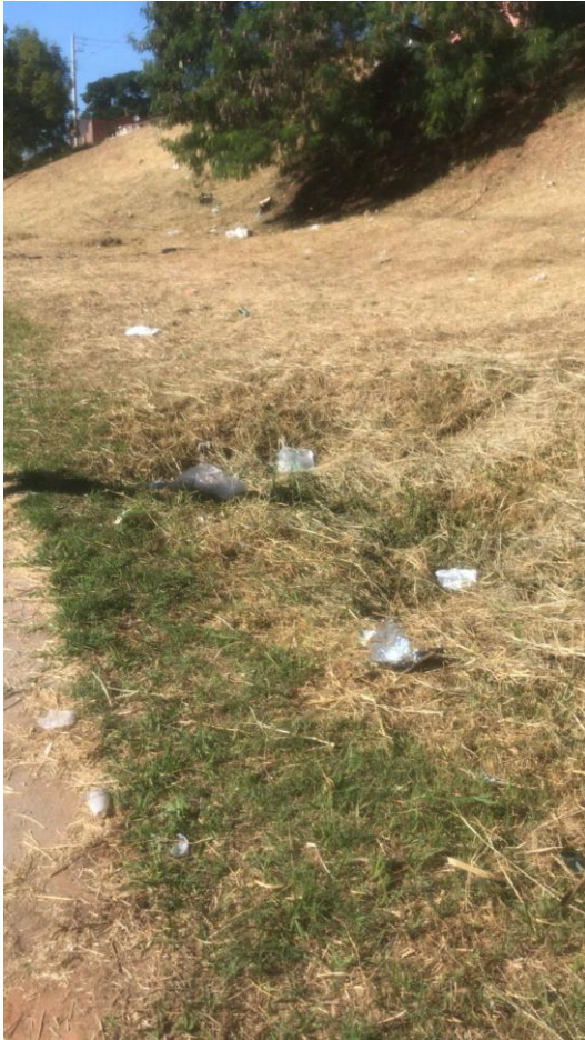
Figura 13 afundamento no gramado que pode gerar riscos, na Avenida Bofete-Pardinho.