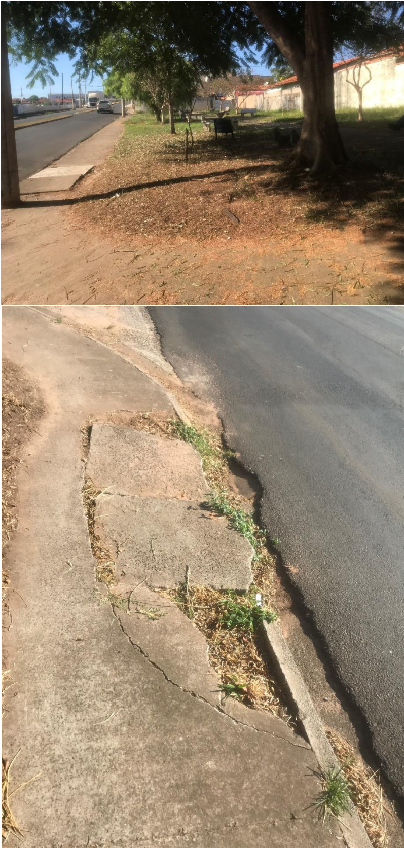
Figura 22 Realizar consertos na calçada da Praça da Cohab, entre avenida Bofete-Pardinho e rua Maria Julia Vieira.