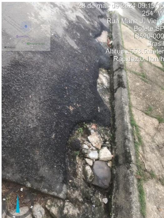
Imagem 34 – Buracos na sarjeta Rua Maria Julia Vieira