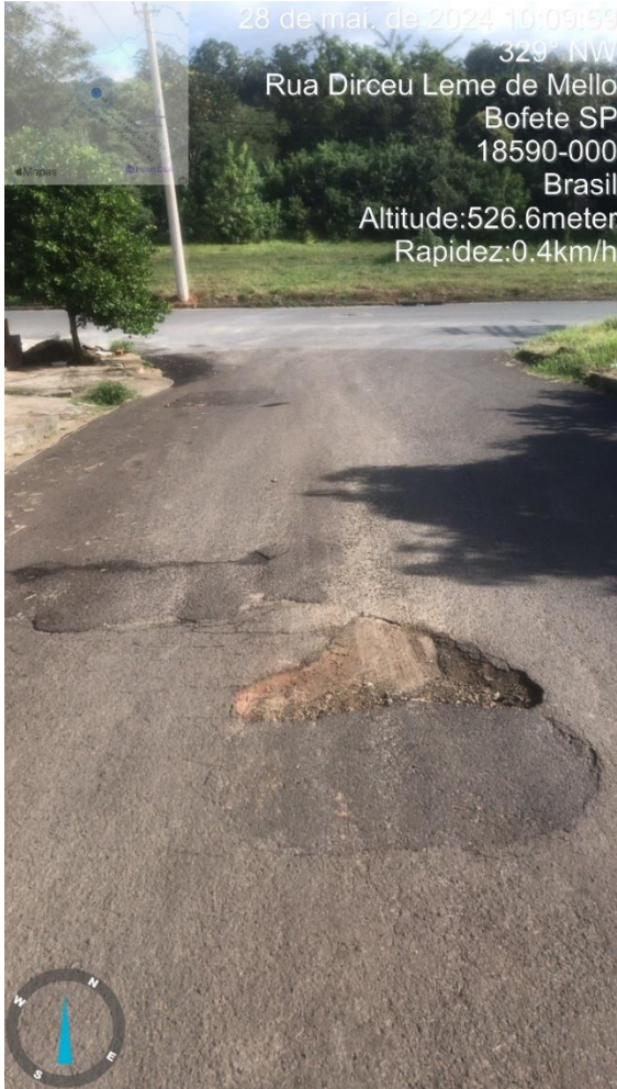
Imagem 60 - Buraco na Rua Dirceu Leme de Melo.