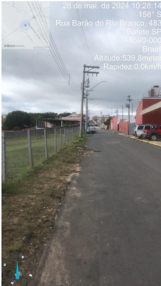
Imagem 67 - Buracos na rua Barão do Rio Branco em frente ao mercado Marcon.