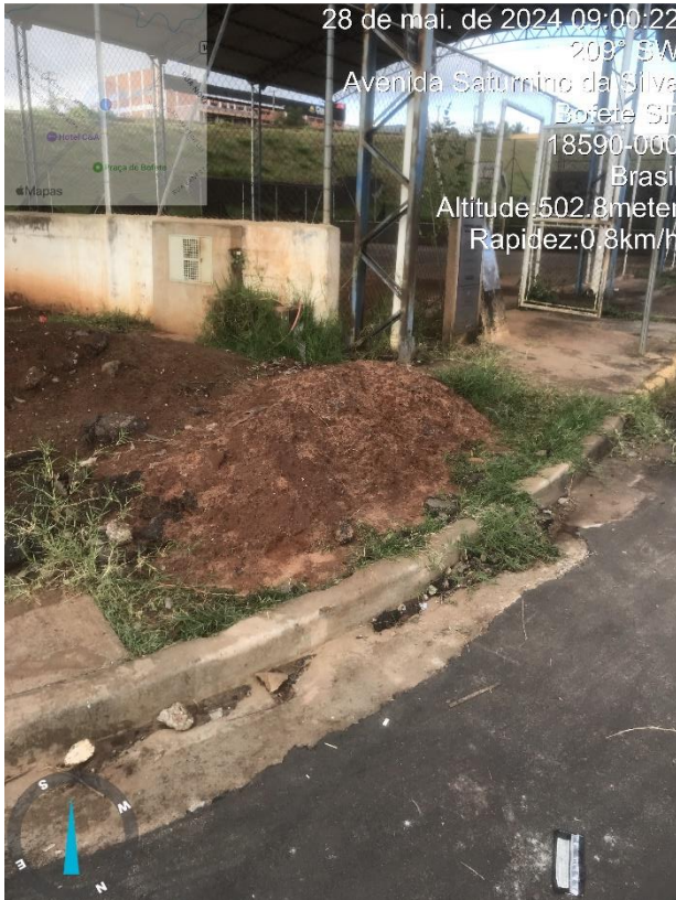
Imagem 16 – Calçada danificada e obstruída, na quadra da R. Roque Cordeiro de Campos.