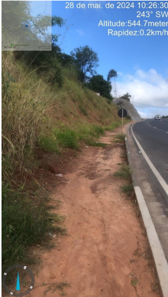
Imagem 66 - Trecho da rodovia sem calçada, ao lado do supermercado Marcon.