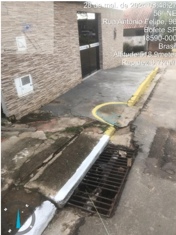
Imagem 12 - Boca de lobo, R. Antônio Felipe.