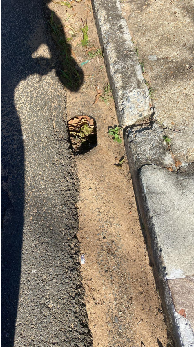
Figura 8 – Buraco em sarjeta da rua Rafael da Silva.