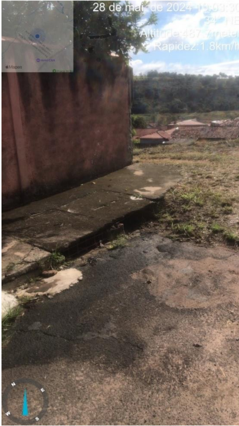
Imagem 53 - Bocas de lobo Rua Antônio Cordeiro Neto