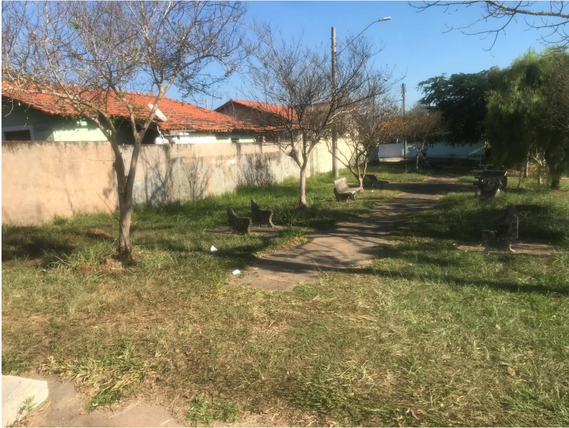
Figura 5 providenciar roçagem da grama. Local: Praça da Cohab, entre avenida Bofete-Pardinho e rua Maria Julia Vieira.