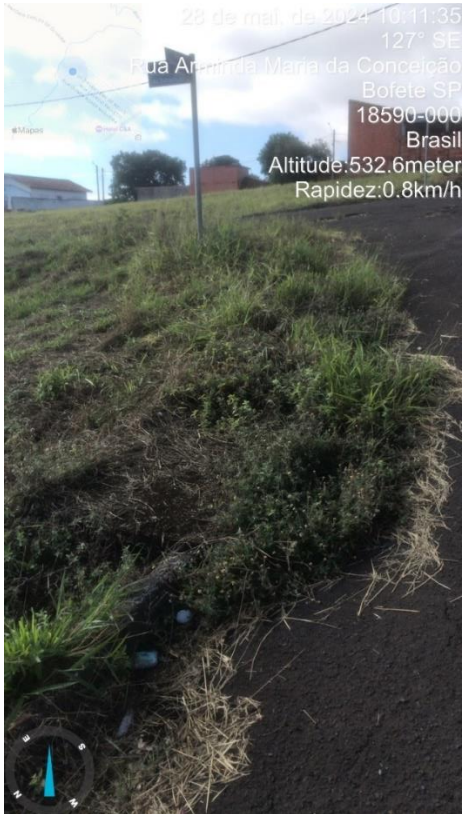
Imagem 61 – Boca de lobo danificada, Rua Dirceu Leme de Melo, esquina com R. Arminda Maria da Conceição.