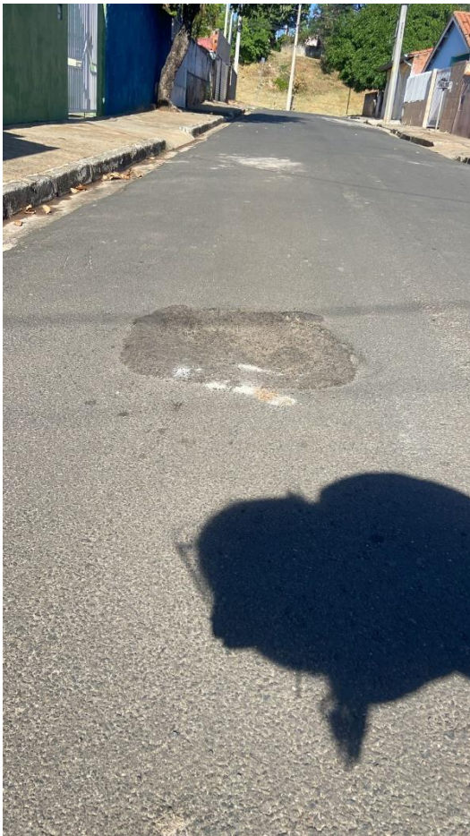
Figura 7 – buraco na rua Rafael da Silva