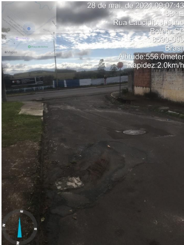
Imagem 27- Buracos na rua Laucidio Justino