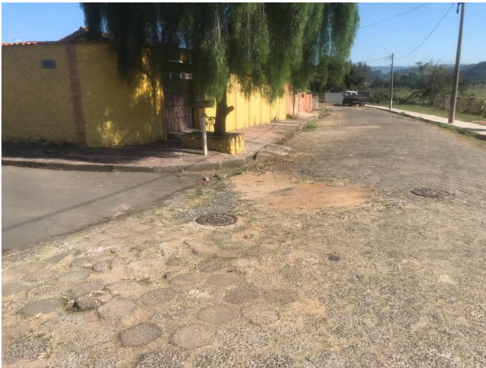
Figura 5 - Buraco na esquina entre Antônio F. Sobrinho com Rua Antônio Neto.