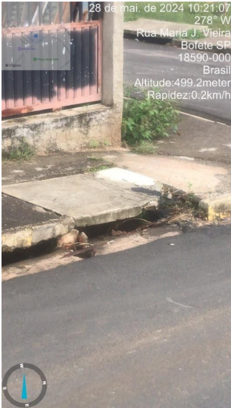
Imagem 65 – Boca de lobo danificada Av. Bofete-Pardinho, esquina com R. Laucidio Justino