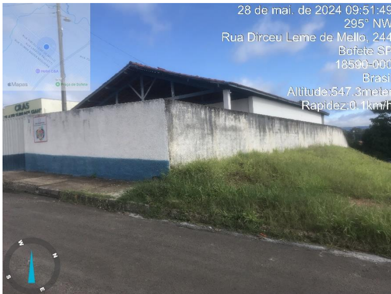
Imagem 40 - Terreno da prefeitura sem calçada (ao lado da Casa Transitória). Rua Ettore Capellari.