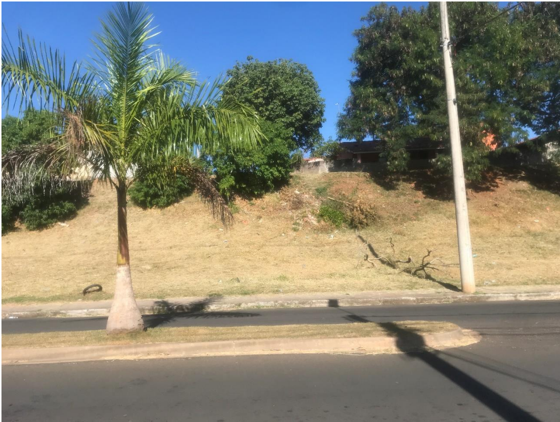
Figura 3- Limpeza do gramado e talude da CDHU II, onde tem alguns lixos, galhos e restos de vegetação na avenida Bofete-Pardinho