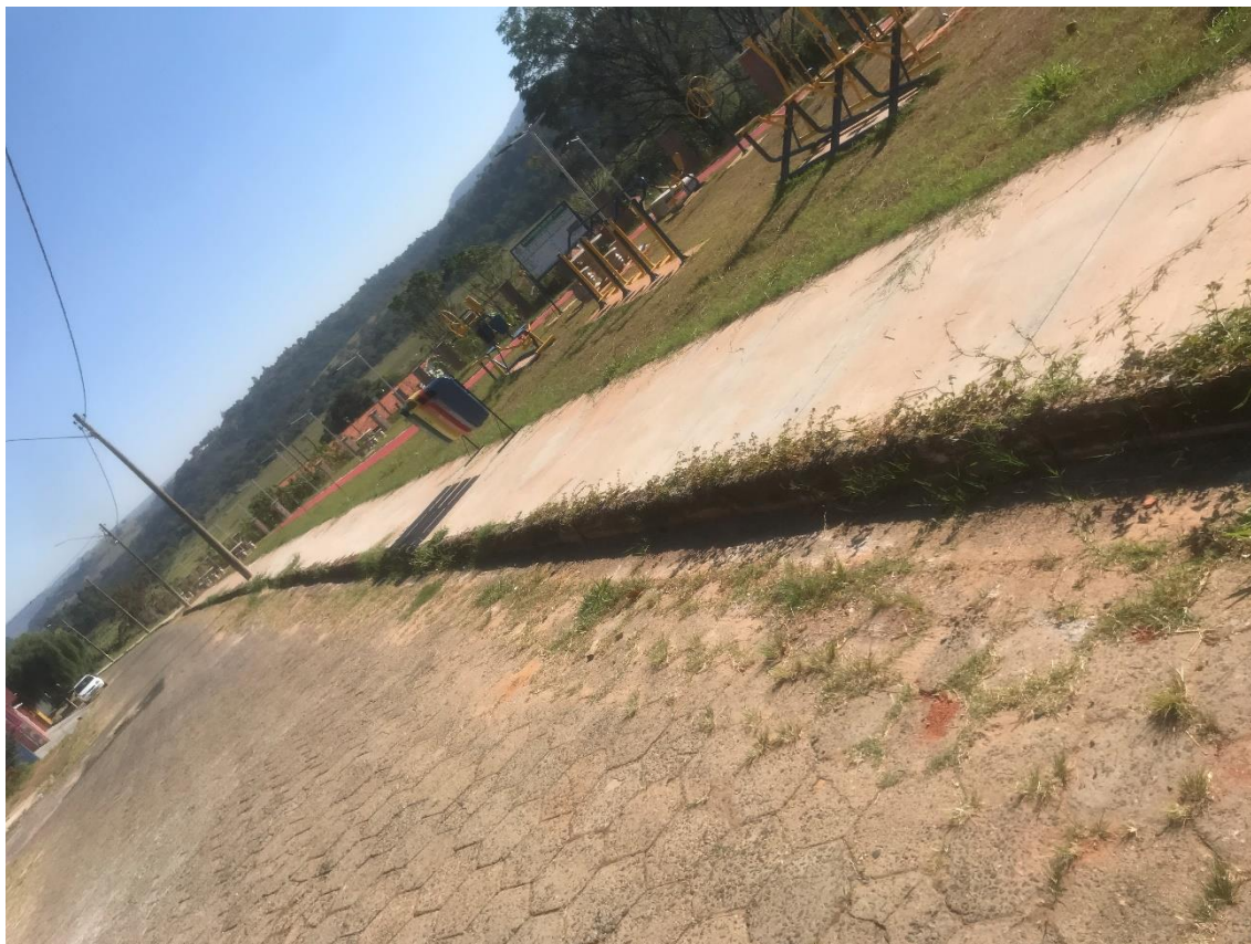
Figura 1- guias, sarjetas e arredores do parque urbano na CDHU II

Por meio deste ofício venho solicitar por gentileza o serviço de roçagem e limpeza de alguns locais vistoriados. Seguem imagens dos locais apontados, para que sejam avaliadas pela equipe de manutenção.