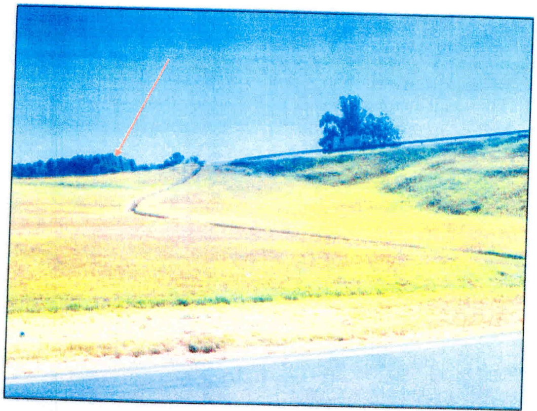
Figura 2: PONTO DE ONIBUS sentido INTERIOR X SÃO PAULO