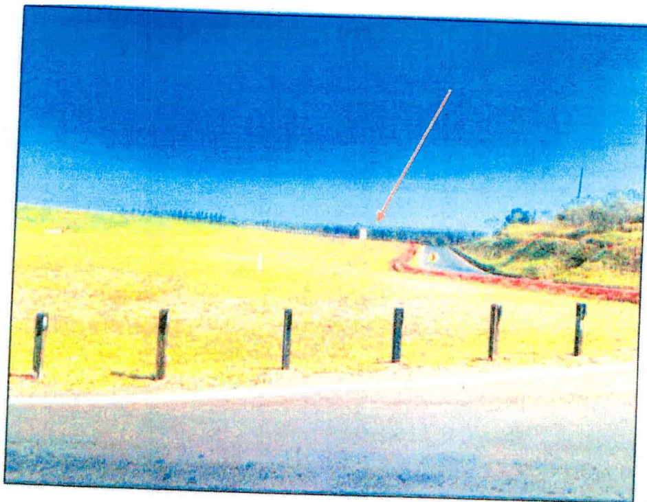
Figura 1: PONTO DE ONIBUS sentido SÃO PAULO X INTERIOR